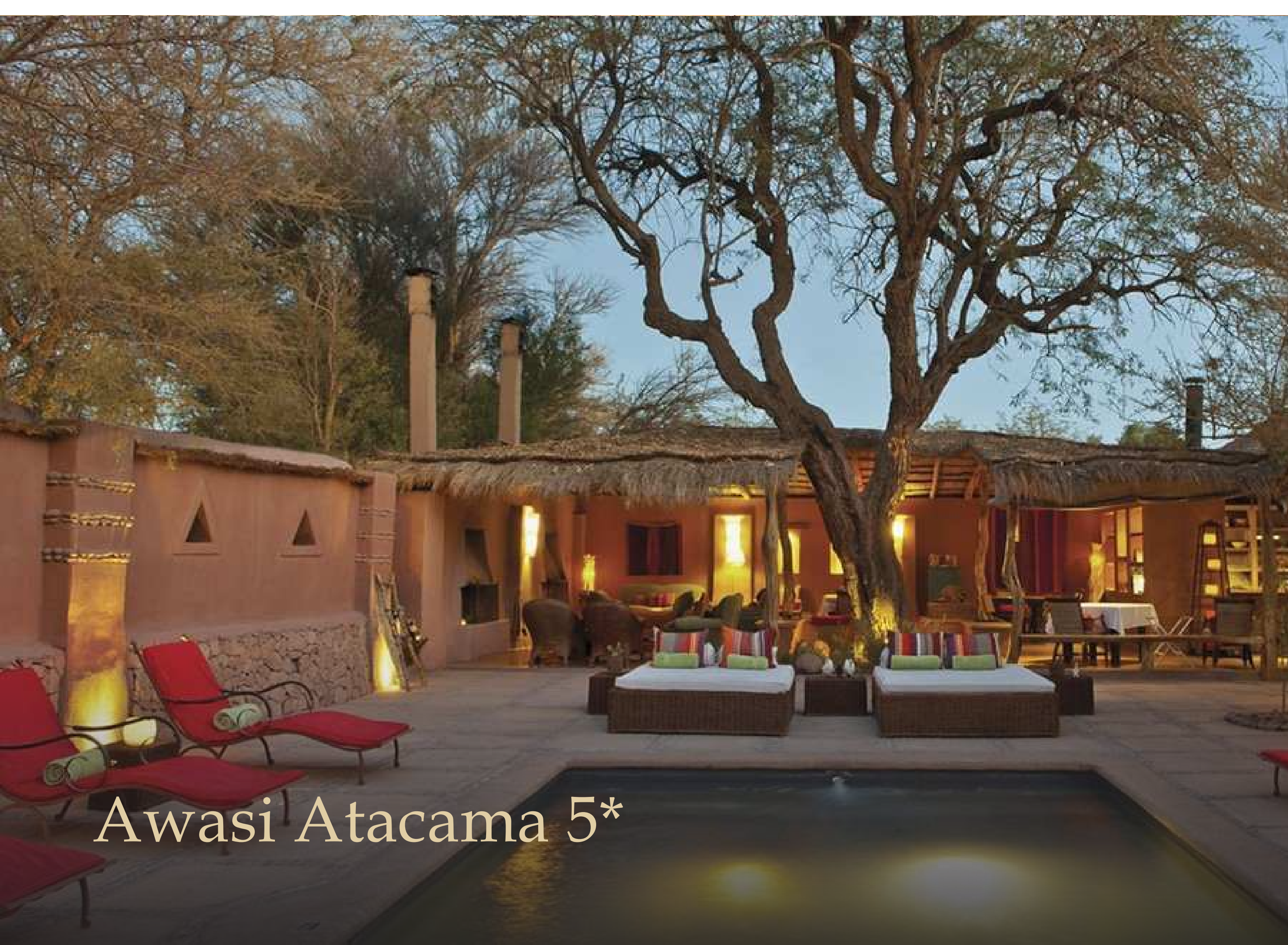
Awasi Atacama 5*