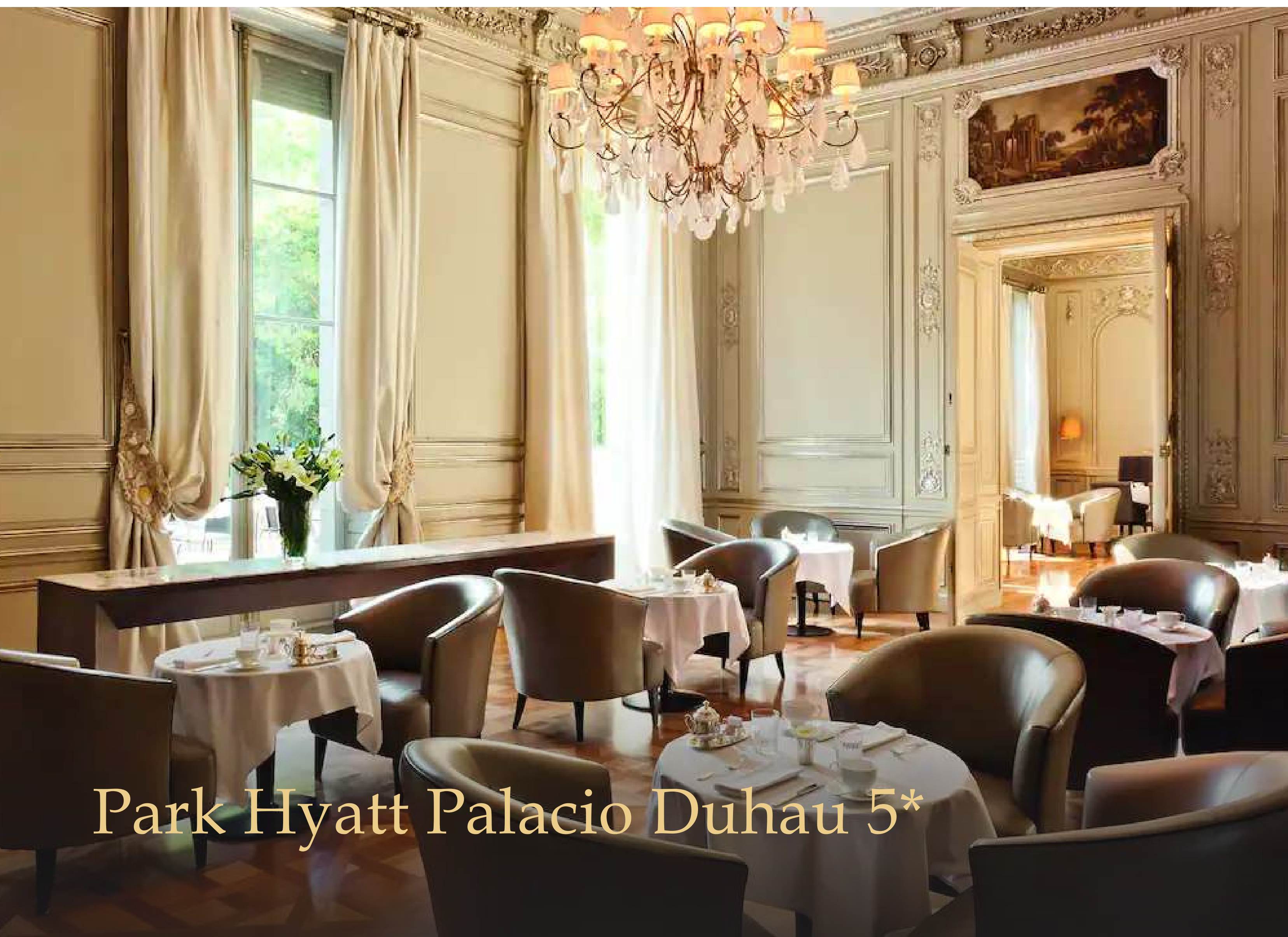
Park Hyatt Palacio Duhau 5*