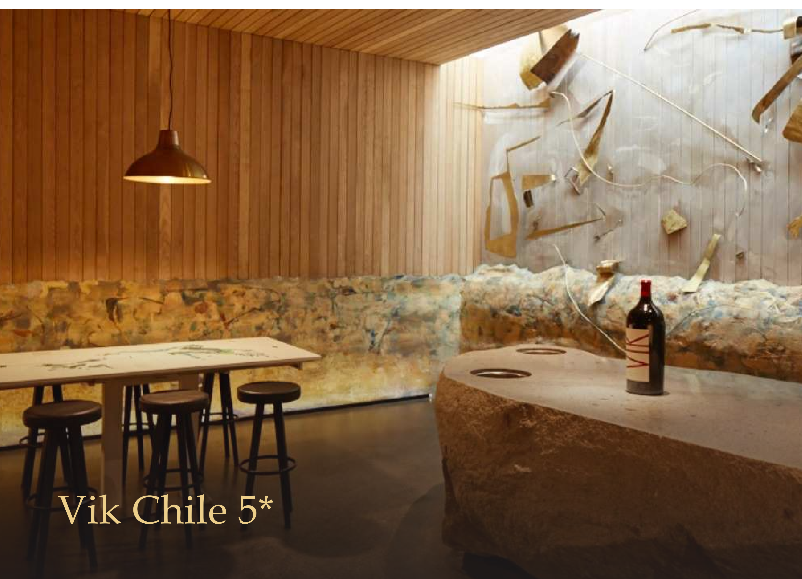
Vik Chile 5*