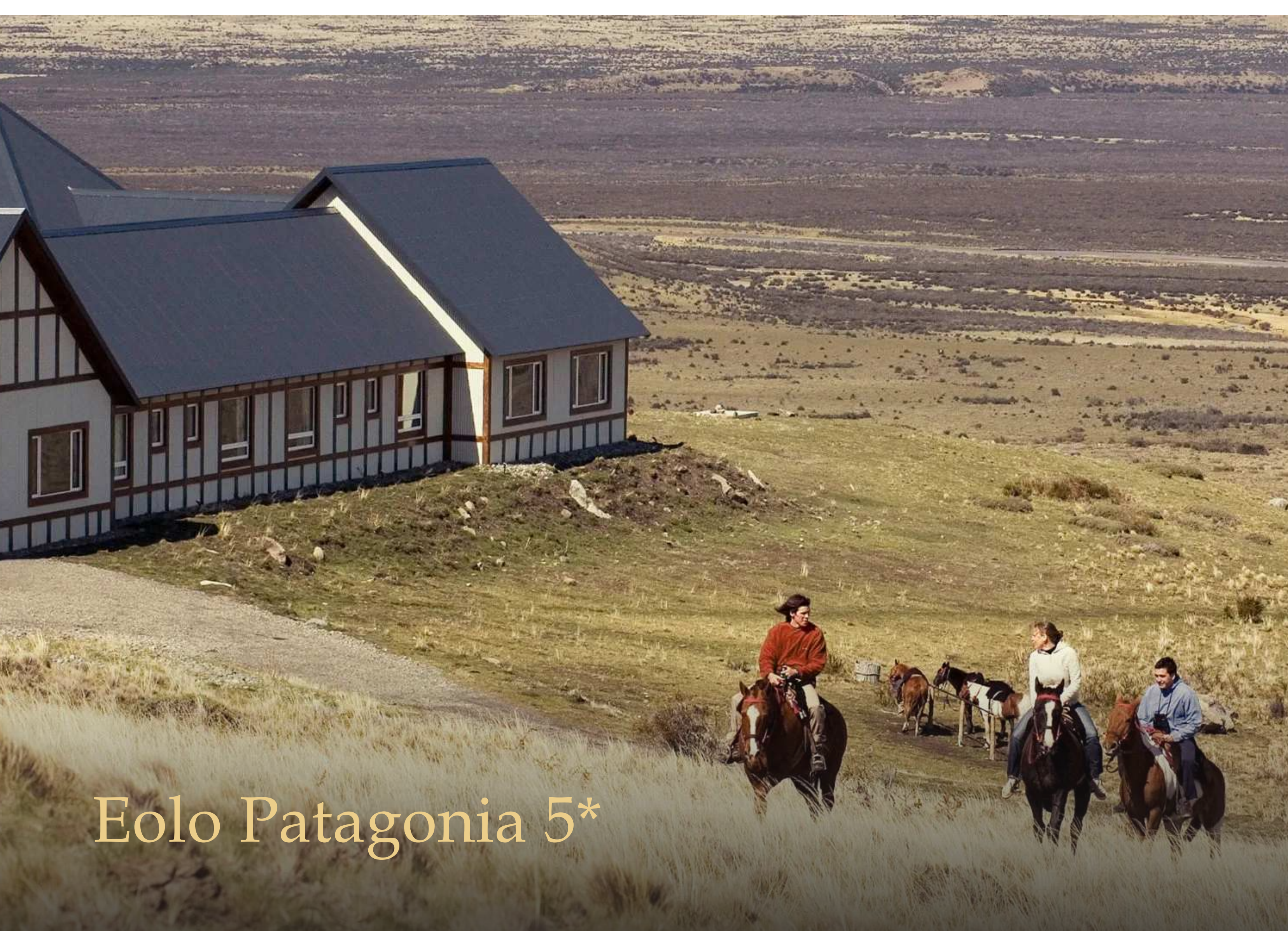
Eolo Patagonia 5*